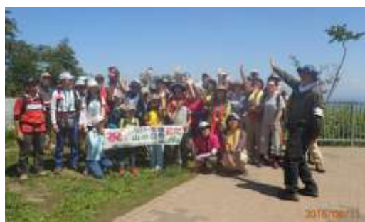
第一回「ふるさとの山を登ろう」記念写真(頂上)