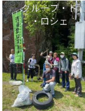
グループ・ド・ロシェ

実施日 2024年6月16日(日) 北海道道央地区勤労者山岳連盟・自然保護委員会