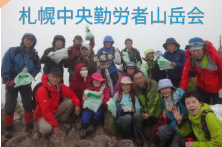
札幌中央勤労者山岳会