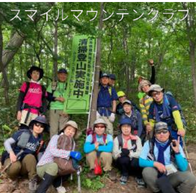
スマイルマウンテンクラブ